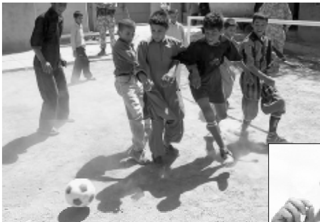
АДРА завърши проект, който имаше за цел оборудването на училище.

АДРА има свои представителства в над 120 страни, като осигурява помощ при бедствия и подпомага развитието на местните общности, без значение каква е тяхната политическа, религиозна, етническа или възрастова принадлежност. ANN