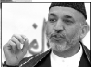
Настоящият президент на Афганистан - Хамид Карзай.

налата бомба загинаха поне 7 души и бяха нанесени значителни щети на представителството на АДРА в Афганистан, а един от неговите служители бе ранен.